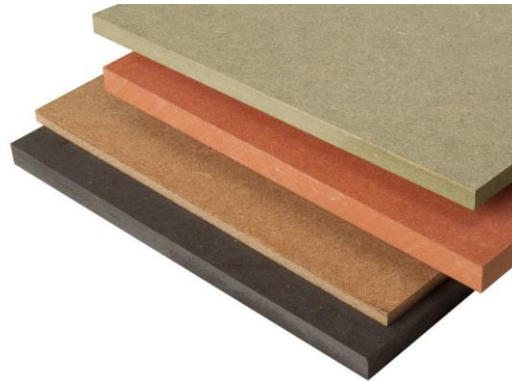
Panneaux de fibres